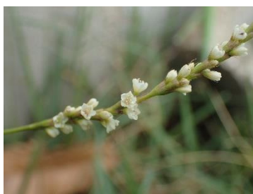
ダイトウサクラタデ (北大東島・南大東島)