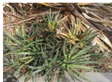
アガヴェ・パルヴィフロラ (アリゾナ～メキシコ)